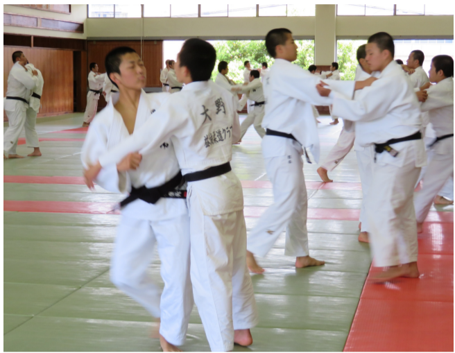
復旧工事が終わった道場で稽古する柔道部員