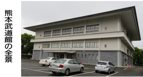
熊本武道館の全景

それぞれ2000人収容の観覧席となっております。大会などがあると、多くの観客が詰めかけ、選手に